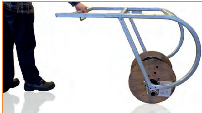
Pukkia voidaan käyttää kelan myös kuljetukseen.

Pukin mukana toimitetaan laakeroitu kela-akseli sekä kelan lukituskartiot. RS 10 - kelapukkia on saatavana sekä jarruttomana että jarrullisena versiona. Jarrun avulla kelan purkuun saadaan sopiva vastus helposti eikä kela pääse pyörimään purkuvaiheessa liikaa. Jarruvaihtoehtoina on panta- tai levyjarru.