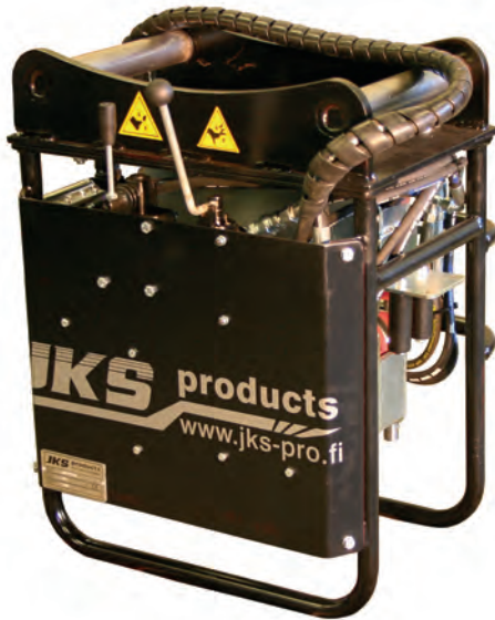
Kaivinkonetta varten PPD 402 voidaan asentaa erilliseen S-45 kiinnikkeelliseen runkoon.