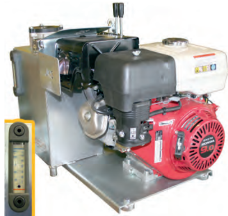
Hydrauliikan voimanlähteenä toimii luotettava Honda GX270 -polttomoottori