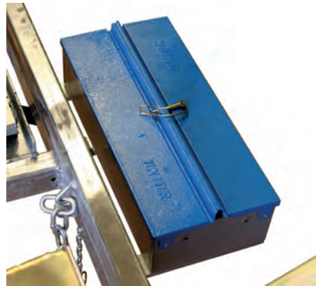
Työkalu- sekä tarvikelaatikko