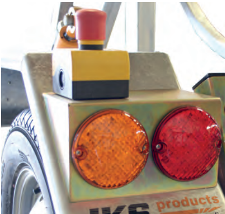
Pitkäikäiset ja kestävät led-valot edessä ja takana.