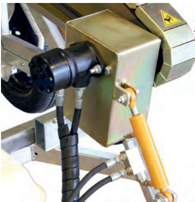
Hydraulinen kelanpyöritys sekä pyörityksen voimansiirron kiristys