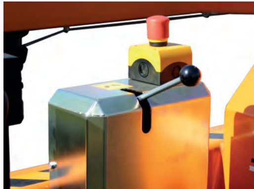
Kelanpyöritys ja hätä-seis-kytkin vaunun takaosassa - käyttäjällä suora näköyhteys kaapeliin