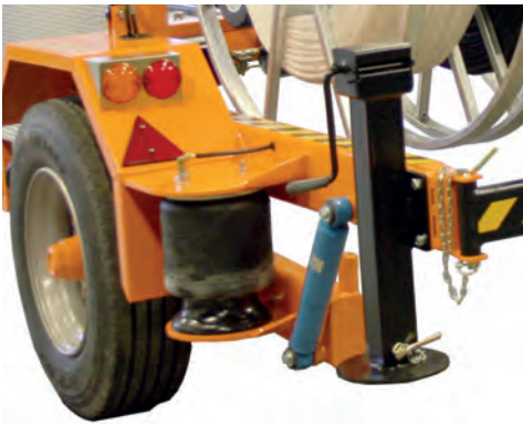
Hinausnopeus nostettavissa 80km/h paineilmajarrujen ja jousien avulla