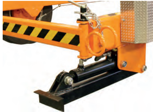
Hydraulisten takatukijalkojen avulla vaunu saadaan ankkuroitua tukevasti paikoileen.