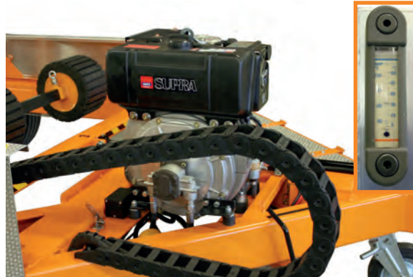
Vaunu voidaan varustaa diesel -moottorilla. Erillistä hydraulioyljsäiliötä ei enää ole.