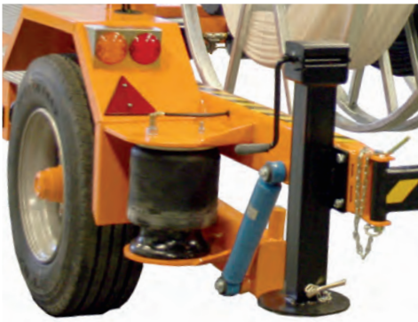
Hinausnopeus nostettavissa 80km/h paineilmajarrujen ja jousien avulla.