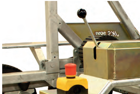
Kelanpyöritys ja hätä-seis-kytkin vaunun takaosassa