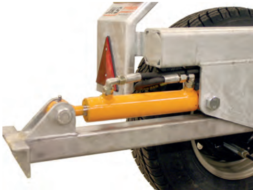
Hydrauliset takatukijalat saatavana lisävarusteena