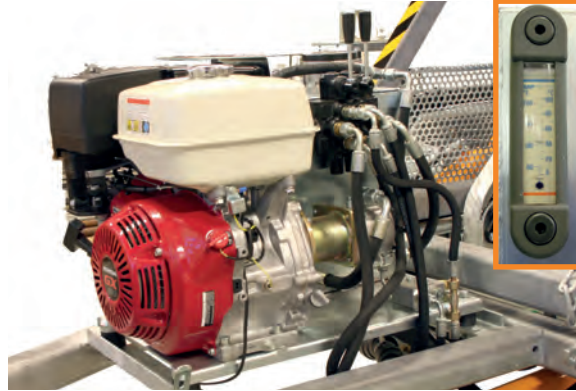
Hydraulikoneikko + 13hp Honda + öljynlämpö-/määrämittari